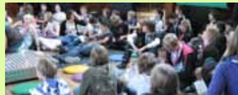
Komm auf Tour! S. 5