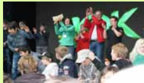
Be-Smart-Party S. 4