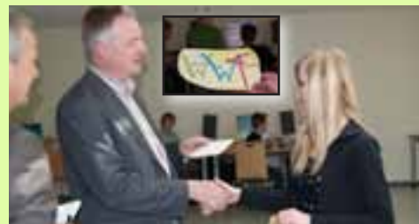
World-Wide-Franziskus S. 7