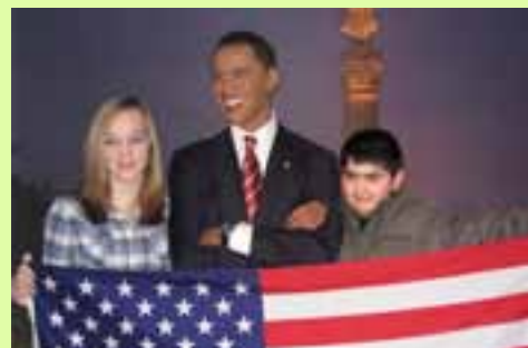
In Berlin S. 2