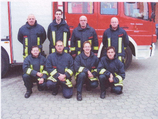
dritte Wachabteilung, die uns durch den Girls - Day begleitet haben